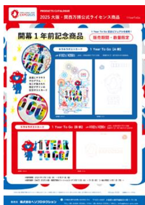
▲キラキラポストカード 1 Year To Go 【A 柄】 / 【B 柄】 各 200 円 税込