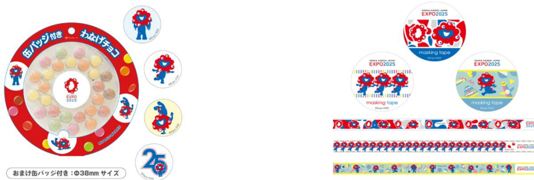
▲缶バッジ付き わなげチョコ (おまけ缶バッジ 1 個付※ブラインド仕様/全 4 種) 756 円 税込