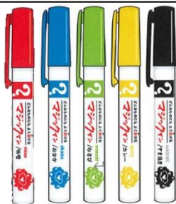
▲ミヤクミヤクマジックふりかけ (赤 : 味噌、青 : おかか、緑 : わさび、黄 : カレー、黒 : すき焼き味) 各 825 円 税込